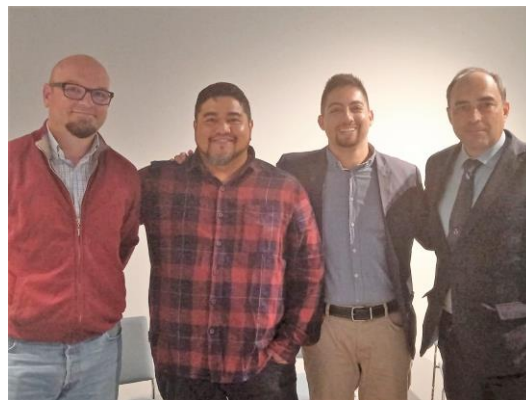
El equipo de Voluntarios de PMI